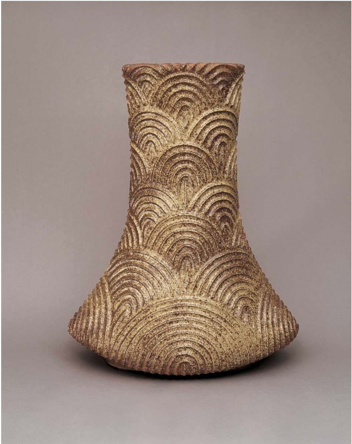
Gerd Knäpper, Torso 1999