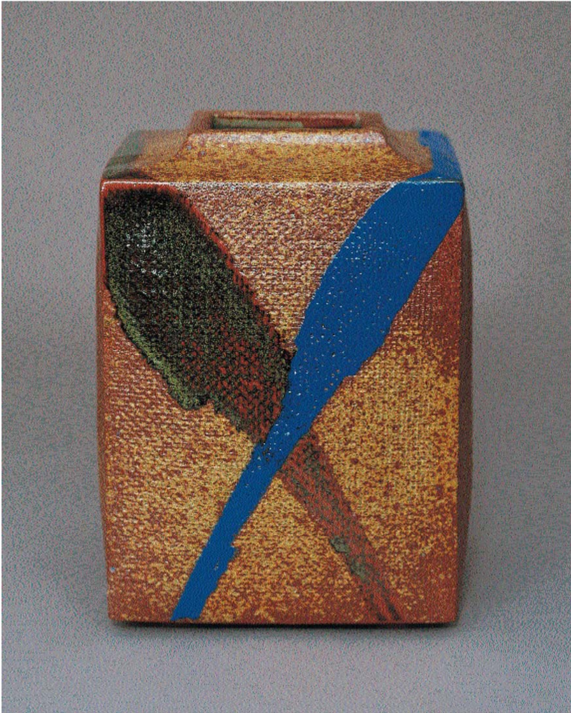
Gerd Knäpper, Vertikale Form, 2003